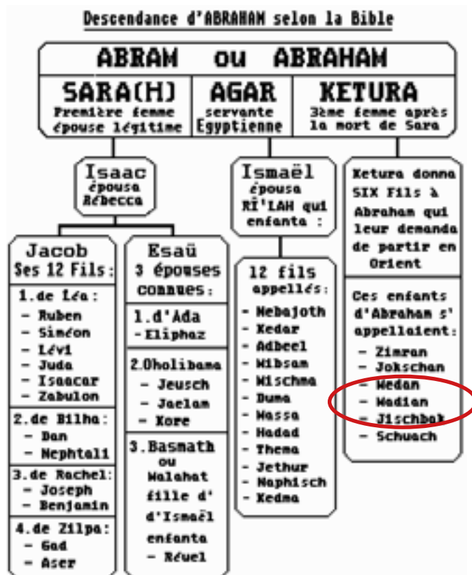
Généalogie de Abraham/Keturah Genèse 25:1-4

Au départ, Yitro est un prêtre idolâtre, un sacrificateur madianite. Tziphora, sa fille, deviendra l'épouse de Moïse qui a rejoint, les enfants d'Israël avec leurs deux fils. Madian est l'un des fils d'Abraham et de sa concubine Ketourah. Ses descendants, les Madianites, s'installent à l'est du Jourdain entre la mer Morte et jusqu'à la péninsule du Sinaï au sud. C'est à ce moment là , après avoir fui l'Égypte, que Moïse y est accueilli par le prêtre de cette