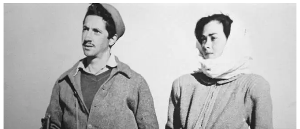
Un couple de pionniers juifs en 1948. En dessous la déclaration d'indépendance de l'Etat d'Israël le vendredi 14 mai 1948 (5 Iyar 5708 du calendrier hébraïque) à 16 heures

Au début de sa vie, depuis qu'il est sorti d'Égypte, le peuple n'a pas beaucoup eu l'occasion de «donner» comme un père ou une mère donnent à leurs enfants. Le peuple est encore comme un bébé à la mamelle qui doit d'abord se nourrir, se développer, se fortifier puis grandir en sagesse, en stature et en grâce devant Dieu et devant les hommes. Aujourd'hui donc, à la veille de rentrer en terre promise de nouvelles «lois» seront données au peuple, que n'avaient pas connues leurs pères. Comparativement à la vie des enfants de Dieu on ne peut pas à proprement parler de lois de l'avant et des lois de l'après. On parlera plutôt de la vie avant le baptême du Saint Esprit et une vie «dans» le Saint-Esprit. Mais ces choses n'ont rien à voir avec le type de peuple dont parlait la Bible «Am Israël» avant, «Qahal Israël» pendant et «Adat Israël» après la conversion. Lorsqu'on