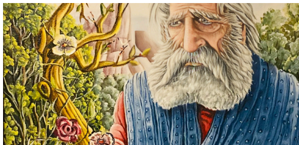
La verge fleurie de Aaron par Rémi Bono Artiste peintre ( https://remibono.com/portfolio/la-verge-fleurie-daaron/ )

Une tribu se dit « matteh » et a comme sens premier le fait « d'aller dans une certaine direction. » Cette branche a la responsabilité de faire le service dans le tabernacle et pourtant ne pas être lié à la terre. La branche d'amandier est la première qui vient en signe devant les enfants d'Israël que l'autorité du sacerdoce Lévitique vient avant tout le reste.