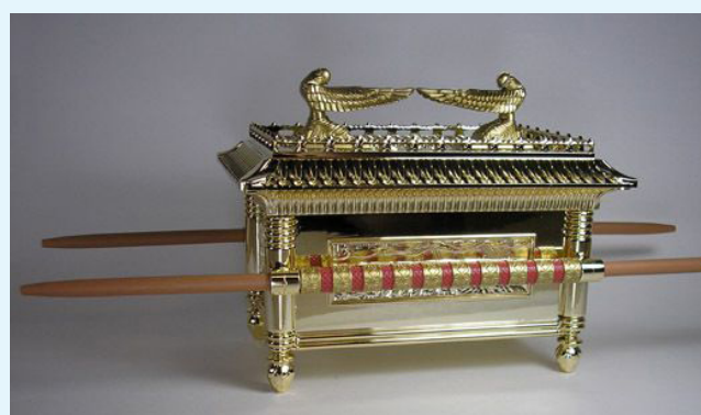
Sur l'Arche de l'Alliance étaient sculptées deux anges, deux séraphins

Les pensées humaines et les esprits sont dans un même «monde», celui de la pensée.