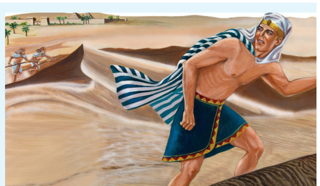
Moïse s'enfuit d'Égypte

מִפְּנֵיךָ Et «tes faces», c'est d'abord un verbe avant d'être un nom pluriel 6437 panah פָּנָה - poneh פּוֹנֶה une racine primaire : se tourner, s'éloigner, préparer, regarder, se retirer, vider, retourner, s'adresser, avoir égard, sur, vers, faire face, du côté, suivre ; (135 occurrences).