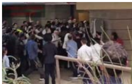
Des juifs orthodoxes tentent de perturber une convention messianique à Jérusalem. Depuis des années, ils luttent contre le prosélytisme chrétien en Israël, en empêchant ici les participants d'assister à l'événement

Puisqu'il y avait des feuilles, Yeshoua pouvait espérer y trouver quelque chose de comestible. Il n'a pas maudit les autres figuiers parce qu'en l'absence de feuilles, il ne pouvait pas s'attendre à trouver des fruits. Ce n'était pas la saison des figes. Mais celui-là, en particulier, avait des feuilles. Il devait donc logiquement avoir des fruits. Malheureusement, il était stérile. C'est l'image du retour des